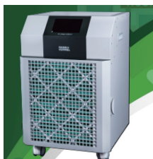
◀ Tri-Kleen 500UV 便携式空气净化器