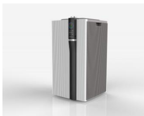
◀ 空气净化器 EPI960