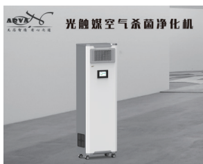
◀ 纳米光触媒空气净化消毒机